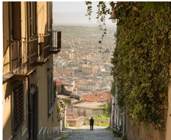
VEDUTA DI NAPOLI DALLA PEDEMONTINA