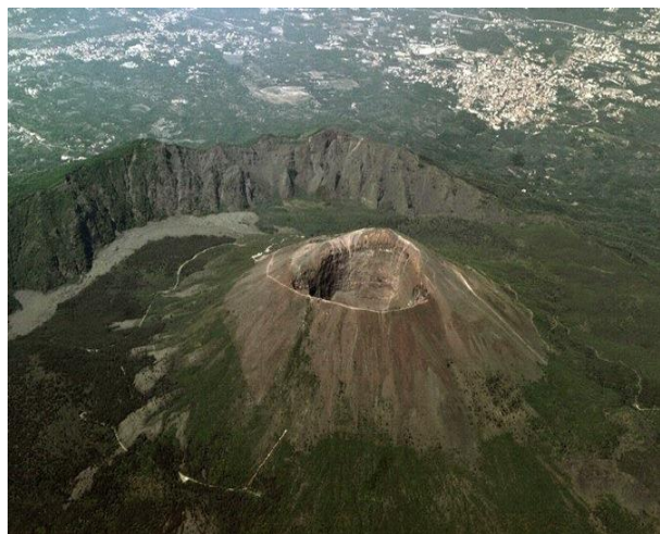
VEDUTA DEL CRATERE

Dichiarazione di esonero di responsabilità: Il Club Alpino Italiano promuove la cultura della sicurezza in montagna in tutti i suoi aspetti. Tuttavia, la frequentazione della montagna comporta dei rischi comunque ineliminabili e pertanto con la richiesta di iscrizione all'escursione il partecipante esplicitamente attesta e dichiara di non aver alcun impedimento fisico e psichico alla pratica dell'escursionismo, di essere idoneo dal punto di vista medico e di avere una preparazione fisica adeguata alla difficoltà dell'escursione della quale conferma aver preso visione delle caratteristiche