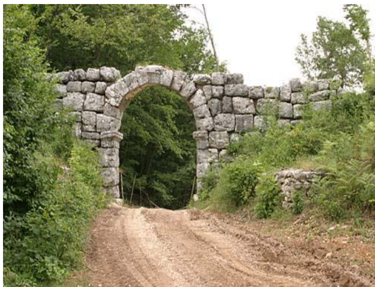
ARCO DI TREVÌ

Dichiarazione di esonero di responsabilità: Il Club Alpino Italiano promuove la cultura della sicurtà in montagna in tutti i suoi aspetti. Tuttavia, la frequentazione della montagna comporta dei rischi comunque ineliminabili e pertanto con la richiesta di iscrizione all'escursione il partecipante esplicitamente attesta e dichiara di non aver alcun impedimento fisico e psichico alla pratica dell'escursionismo, di essere idoneo dal punto di vista medico e di avere una preparazione fisica adeguata alla difficoltà dell'escursione della quale conferma aver preso visione delle caratteristiche